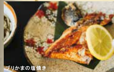
ブリかまの塩焼き