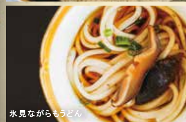
氷見ながらうどん